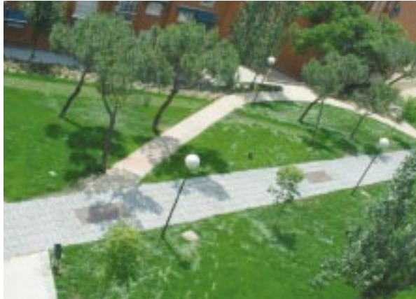
Resultado final de la actuación