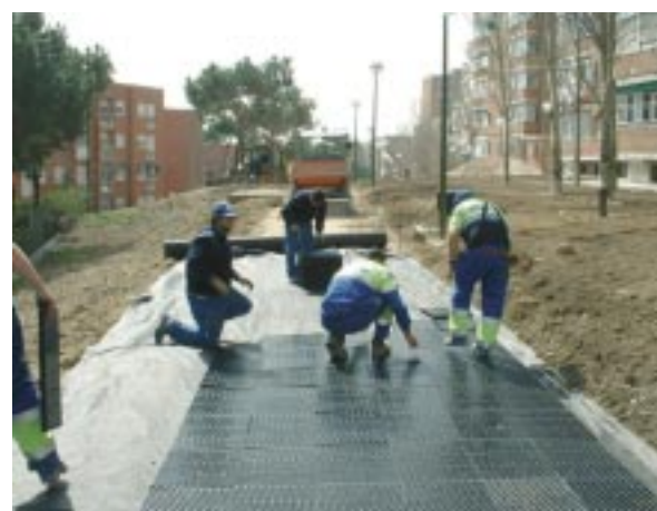
Instalación de pavimentos. Gravilla

los criterios y tecnologías utilizadas hasta la fecha, en lugar de trasladar e incrementar la contaminación desde A (colector) hasta B (depuradora), estos nuevos criterios apuestan por solucionar en origen los problemas de cantidad y calidad de agua.