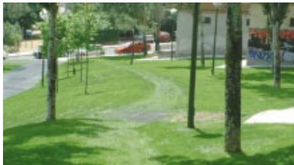
Instalación de pavimentos. Senderos vegetados

El sistema conlleva un profundo cambio respecto a