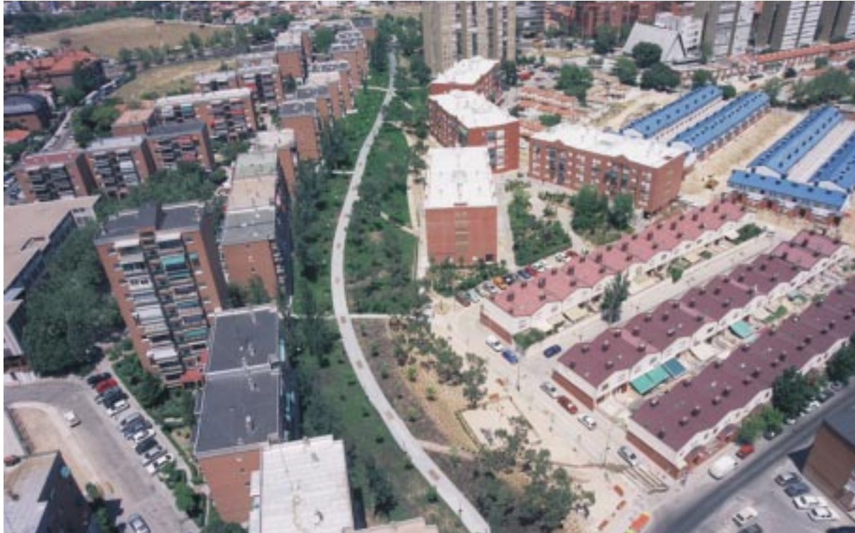
Foto aérea de la actuación